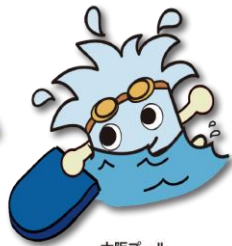
大阪プール イメージキャラクター おさぽー