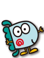
日本マスターズ水泳協会 マスコットキャラクター JAMBOW (ジャンボウ)