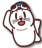
日本パラ水泳連盟 マスコットキャラクター パラッシーJr