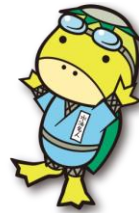
日本スイミングクラブ協会 マスコットキャラクター かっぱの忍者 にんてー君